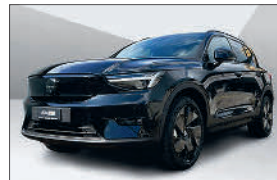
Volvo EX40 Twin Bl. Ed. AWD 5'000 km, 10.2025 CHF 51'585.- CHF 55'985.-