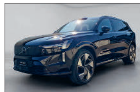
Volvo EX90 Twin Per. Ult. AWD 6'000 km, 08.2025 CHF 88'764.- CHF 89'914.-