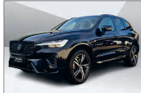
Volvo XC60 T8 Plus eAWD 56'000 km, 09.2022 CHF 53'435.- CHF 57'093.-