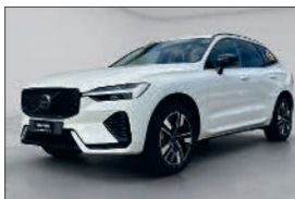
Volvo XC60 B5 Plus AWD 20'500 km, 06.2025 CHF 57'968.- CHF 58'451.-