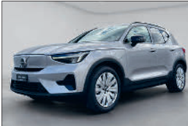
Volvo XC40 E80 Core 38'000 km, 09.2023 CHF 31'989.- CHF 32'964.-