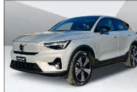
Volvo C40 P8 Twin Ult. AWD 41'500 km, 07.2023 CHF 31'474.- CHF 34'249.-