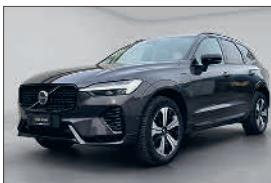
Volvo XC60 T6 Plus eAWD 20'500 km, 04.2025 CHF 55'515.- CHF 58'693.-