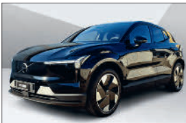
Volvo EX30 E60 Plus 6'000 km, 10.2025 CHF 36'363.- CHF 37'898.-

Fahrzeug jünger als 5 Jahre ✓ Maximale Laufleistung von 150'000km ✓ 100 Punkte Kontrolle ✓