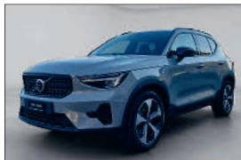
Volvo XC40 B4 Plus Dark 23'000 km, 06.2025 CHF 39'993.- CHF 42'138.-