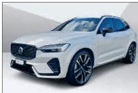
Volvo XC60 T8 Ult. Dark eAWD 12'000 km, 05.2023 CHF 64'797.- – CHF 72'498.-