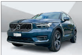
Volvo XC40 T4 PIH Inscr. Exp. 35'000 km, 03.2022 CHF 37'957.- – CHF 45'650.-

Fahrzeug jünger als 5 Jahre ✓ Maximale Laufleistung von 150'000km ✓ 100 Punkte Kontrolle ✓