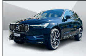
Volvo XC60 B5 Inscript. AWD 30'000 km, 10.2022 CHF 54'263.- – CHF 65'862.-