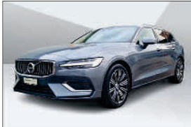
Volvo V60 T6 Inscript. eAWD 32'500 km, 10.2020 CHF 38'169.- – CHF 46'964.-