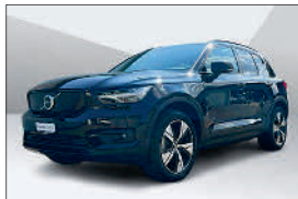
Volvo XC40 P8 Twin Pro AWD 43'000 km, 12.2021 CHF 39'928.- – CHF 47'980.-