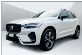
Volvo XC60 T6 R-Design eAWD 70'000 km, 07.2021 CHF 39'864.- – CHF 49'890.-