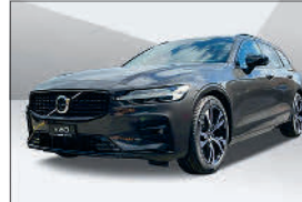
Volvo V60 B4 Plus Dark 13'000 km, 01.2024 CHF 49'926.- – CHF 74'030.-