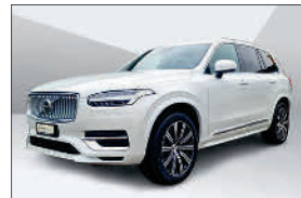
Volvo XC90 B5 Plus 7P. AWD 18'000 km, 02.2024 CHF 66'858.- – CHF 71'896.-