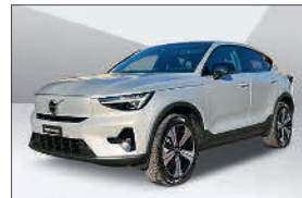
Volvo C40 P8 Ultimate AWD 17'000 km, 07.2023 CHF 46'428.- – CHF 57'690.-