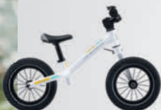
MUSTANG RODEO 12

Mit den Bikes der Serie CAMPUS E kommen Pendler, Studenten und alle andern, die auf zuverlässige Mobilität angewiesen sind, jederzeit schnell und sicher von A nach B.