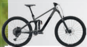
BIXS LANE 260

Das RODEO 12 ist der Anfang aller Dinge. Zumindest als Vorstufe zum Radfahren für die Kleinsten. Sie lernen die Balance zu halten und entwickeln ein Gefühl für die Geschwindigkeit.