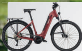
BIXS CAMPUS E30 DI