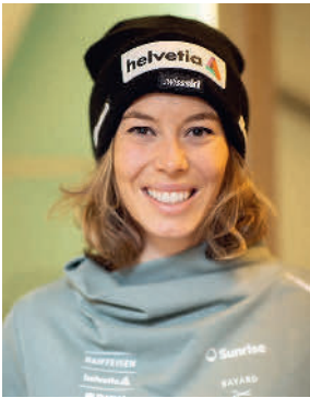
Michelle Gisin (Jg. 1993, Nationalmannschaft, Ski Alpin)

Ab 11.00 Uhr spielt die Musikgesellschaft Engelberg das traditionelle 1. August-Konzert. Bei schlechtem Wetter finden die Veranstaltungen im Kursaal Engelberg statt.